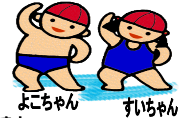
よちちゃん すいちゃん